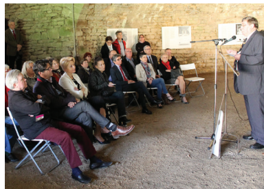
Forges de Buffon