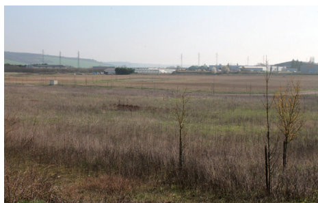
Actipôle va accueillir sa première entreprise

Les serres vont pouvoir entrer en activité dans la ZAC ACTIPÔLE suite aux quelques semaines de travaux envisagés pour leur construction. Ce chantier nécessitera deux mois et demi de terrassement, soit 90 000 m 3 de terre à bouger sur une surface de 85 000 m 2 . 32 semaines de travaux sont