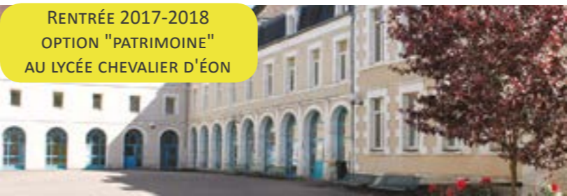
RENTÉE 2017-2018 OPTION "PATRIMOINE" AU LYCÉE CHEVALIER D'ÉON

Une enveloppe financière d'un montant de 40 000€ sera allouée spécifiquement pour le plan numérique dans les écoles du territoire . Les investissements ont été définis en concertation avec les équipes enseignantes. Plus d'infos : www.letonnerroisenbourgogne.fr/Actualites